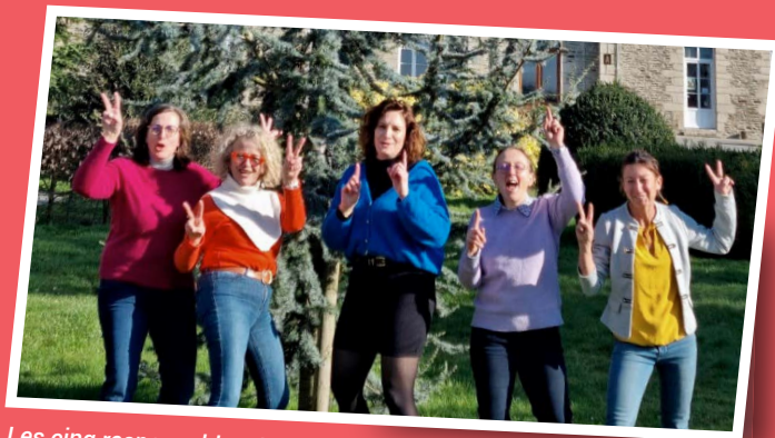
Les cinq responsables des centres d'éducation et d'accueil d'Estival : du Palandrin, de Créac'h Balbé, des villages des Sources d'Armorique et de Derval et des Escales de Nantes et de Landerneau.

L'association Peeps La Mennais – anciennement Foi et Prière – vient par ailleurs d'annoncer sa fusion au sein d'Estival. Occasion de réjouissance encore : l'ouverture du nouveau centre d'accueil de Créac'h Balbé, Finistère, France : www.creachbalbe.fr