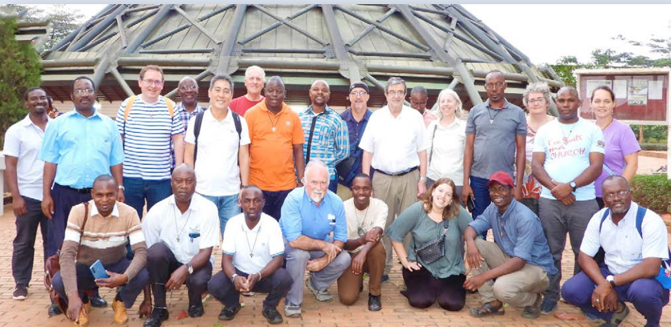
Les participants-formateurs lors de la visite du sanctuaire des Martyrs d'Ouganda.

Une rencontre de 5 jours a eu lieu à Kisubi, Ouganda, en février dernier. 25 Frères et Laïcs y ont pris part. Cette formation va se poursuivre en ligne, jusqu'en juillet 2025, où une nouvelle formation aura lieu à Ploërmel.