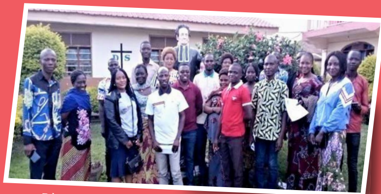
Frères et laïcs de Bunia, RDC, lors de la journée du fondateur en novembre dernier.

La famille mennaisienne de Bunia, République démocratique du Congo, se retrouve régulièrement pour des rencontres.