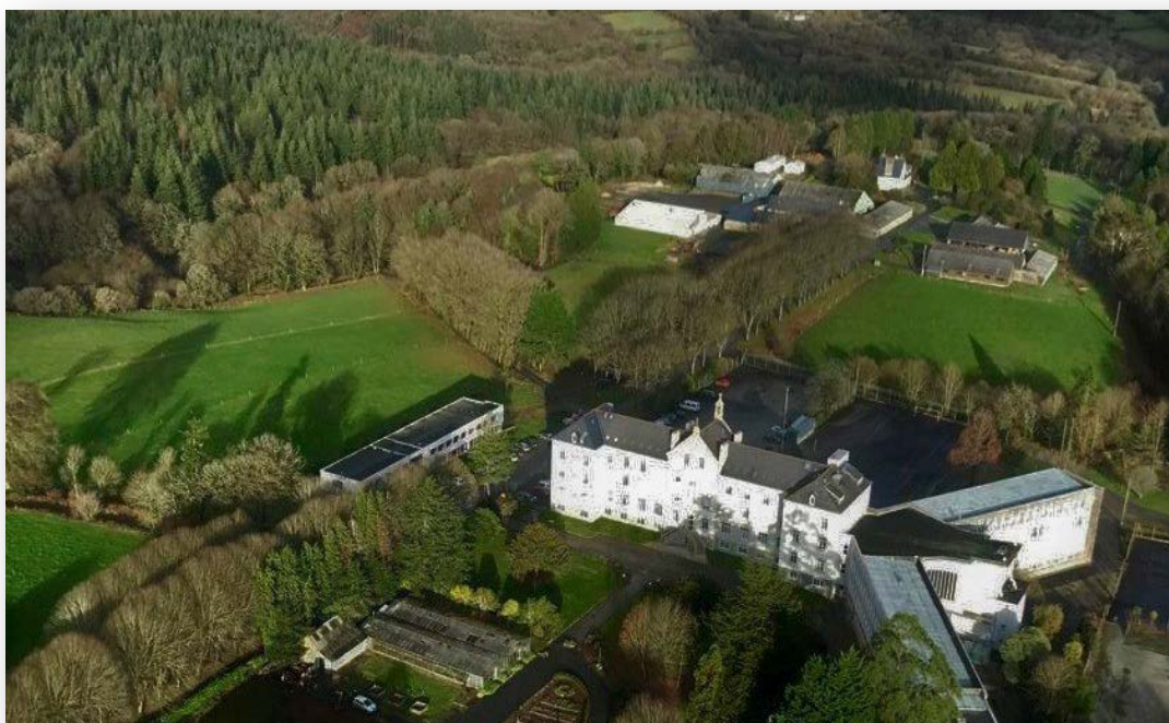
Un établissement niché au cœur de 350 hectares d'un massif forestier remarquable.

Le centenaire de l'établissement dirigé par Cédric Troadec sera marqué par une célébration le 18 mai prochain et d'autres rendez-vous cet automne. Contact : https://www.lenivot.net/