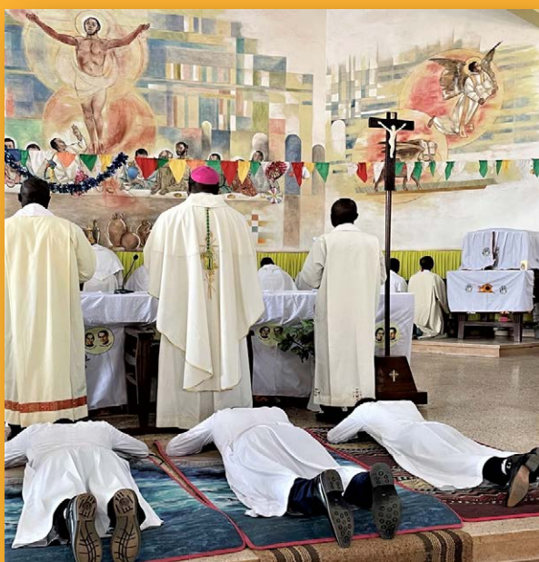
Vœux perpétuels de trois Frères au Rwanda, en janvier dernier. Les Frères ici lors de la litanie des saints.

« Le Frère est le témoin du Christ à travers son mode de vie. Il partage la vie fraternelle et la mission. Son enseignement doit avoir une cohérence avec la parole du Christ, au quotidien de leur vie ».