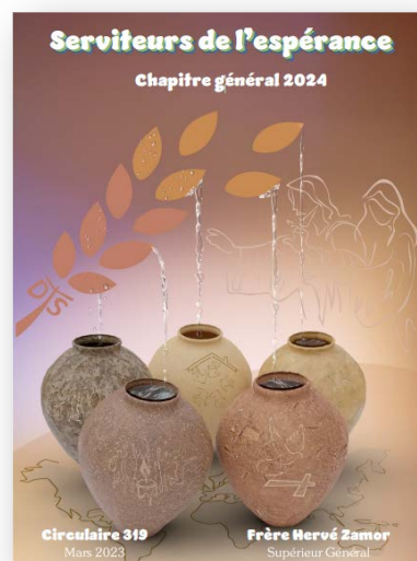
L'icône symbole aidera à cheminer vers le prochain Chapitre général.

Le document est téléchargeable sur le site ici : https://www.lamennais.org/document/circulaires-du-superieur-general/