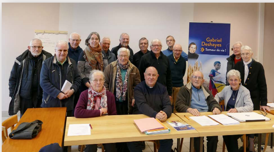
Les responsables des Filles de la Sagesse, des Frères de Saint-Gabriel, des Sœurs de l'Instruction Chrétienne de St-Gildas, des Frères de l'Instruction Chrétienne – La Mennais, Ploërmel et des Missionnaires Montfortains – Pères et Frères de la Compagnie de Marie en compagnie d'adhérents de l'association des Amis Deshayes, lors de l'assemblée à la Maison-mère de Ploërmel.

Contact de l'association Amis Gabriel Deshayes : claudelaunay2@orange.fr