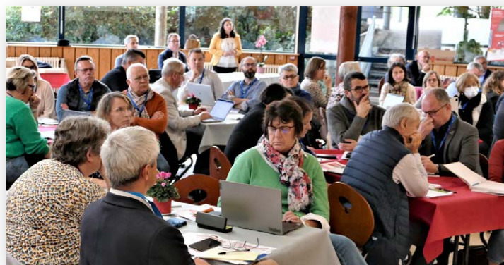
Le Réseau La Mennais Education France c'est 35 393 enfants et jeunes et 3 600 personnels, second réseau congréganiste. Ici, lors de la rencontre annuelle des directeurs.