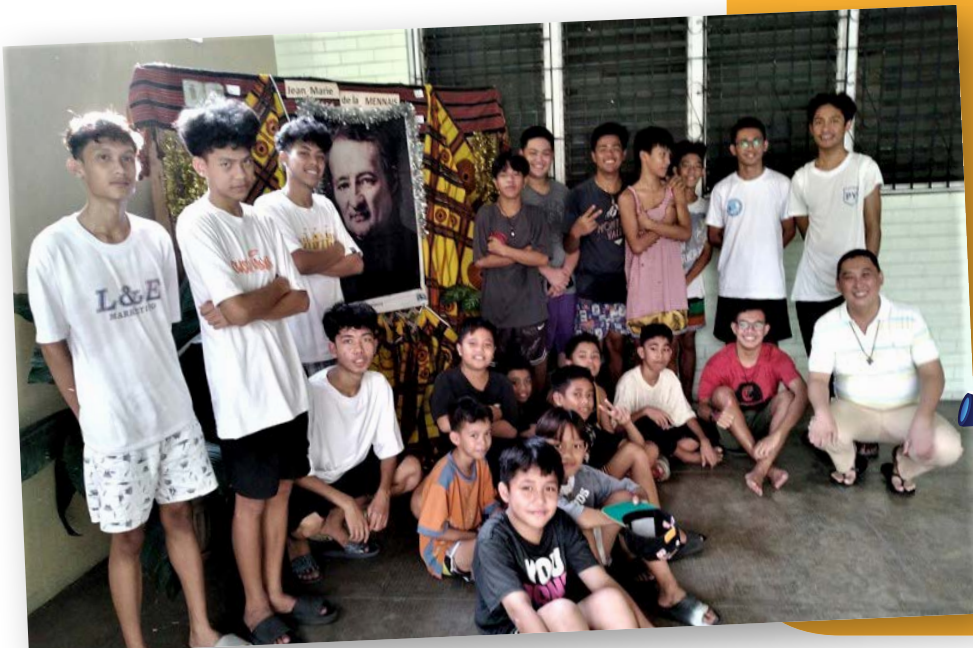
Avec les jeunes du quartier -où sont les Frères à Manille- qui viennent jouer au basket. Une brève célébration, suivie d'un pot de l'amitié à l'occasion de la fête du Père en novembre dernier.