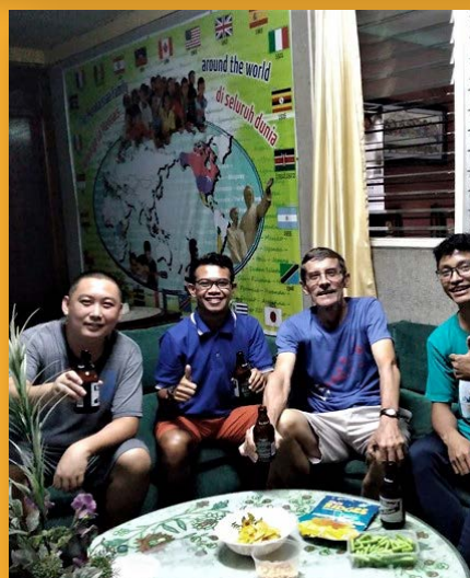
Notre traditionnelle soirée du vendredi « happy hour » au scolasticat de Manille, Philippines.