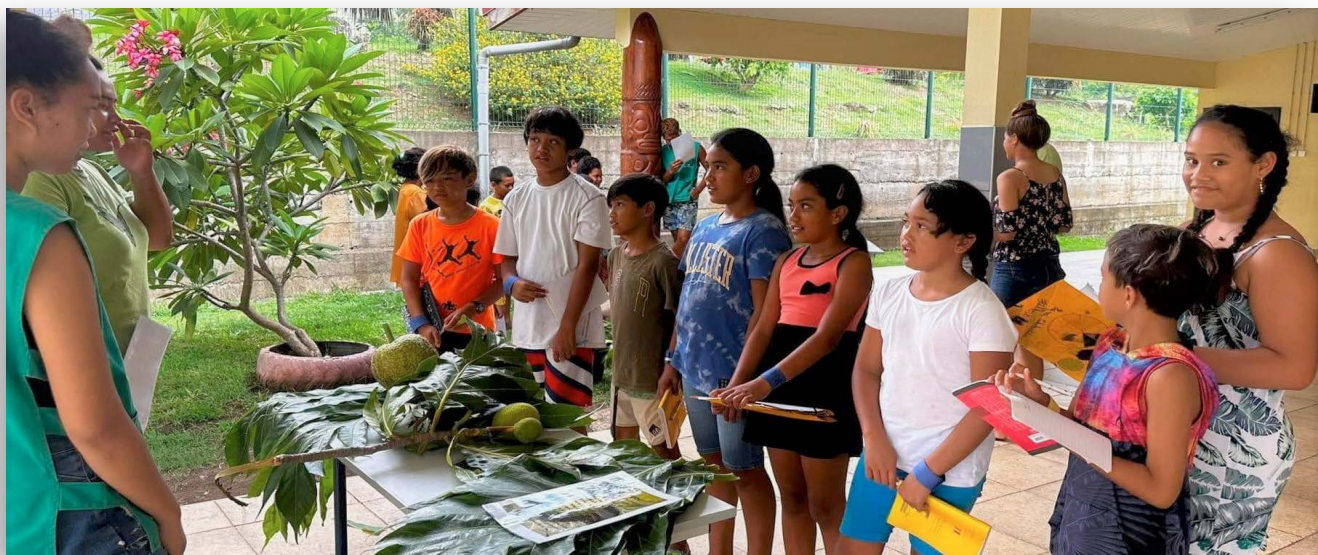
Fierté des jeunes du Lycée St Athanase, de Te Henua Enana, anciennement CED St Joseph.

Les jeunes de 3 ème ont animé de multiples ateliers auprès des écoles primaires des Marquises ces dernières semaines.