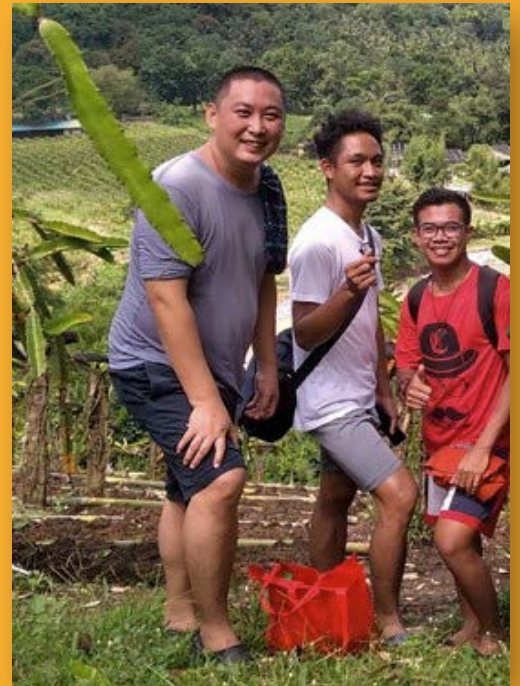
Lors d'une sortie dans la montagne non loin de Manille.