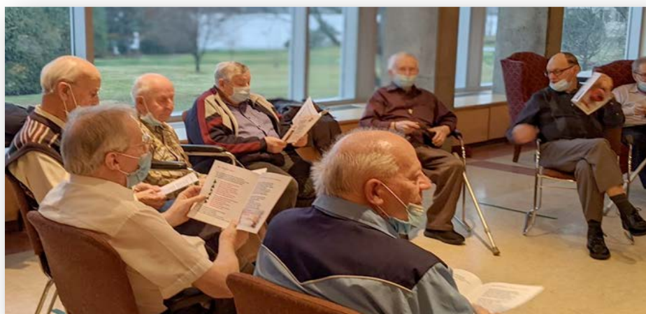
Les Frères sont à la Résidence depuis une année.