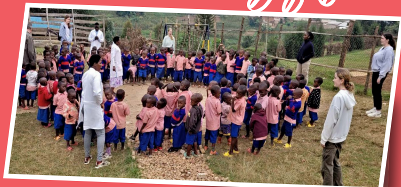
Un voyage inoubliable au Rwanda pour les 14 jeunes du lycée St François d'Assise de Savenay, France.