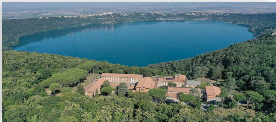
Le Chapitre va se dérouler à Ariccia, à la Maison d'accueil Casa Maestro, tenue par la Famille spirituelle Paulinienne.

Le prochain Chapitre général – assemblée de Frères élu chargée de définir les orientations des 6 prochaines années - est à présent annoncé. Il va se tenir à Ariccia , sur les hauteurs de Castel Gandolfo, en Italie – pas très loin de Rome – du 26 mars au 24 avril 2024 .