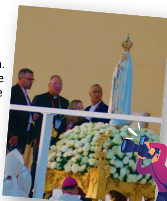
Ici une statue de Notre Dame de Fatima où le pape est allé durant ces JMJ.

Marie cultive la joie en chemin. Elle nous dit que pour faire croître et garder la joie, il faut apprendre l'art de la marche.