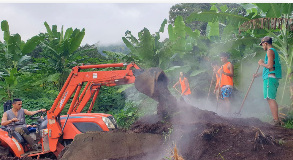
Les élèves de 1ère Bac Pro CGEA retournent le tas de compost pour l'aérer. Après trois mois environ il sera utilisé comme engrais et amendement organique pour nos cultures.