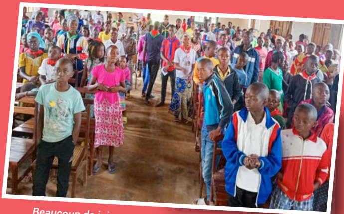
Beaucoup de joie pour ces nouvelles activités de vacances dans le diocèse de Dungu-Doruma au Rwanda.