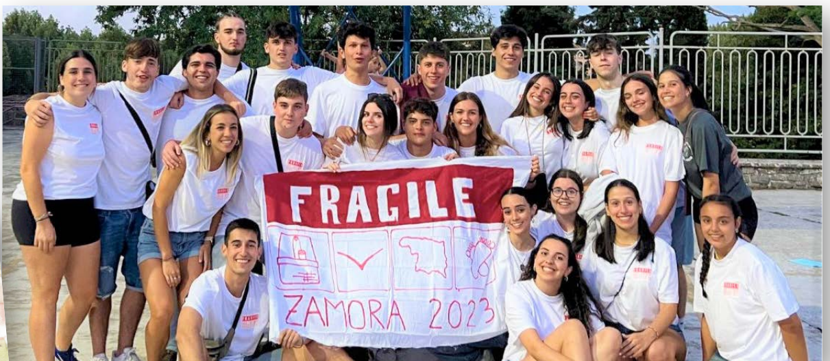
De très nombreux camps ont été organisés cet été dans toute la Province d'Espagne. Ici à Zamora.