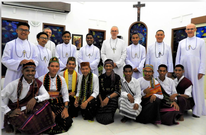
A Yogyakarta, la communauté ici au complet est bien animée avec de nombreux jeunes en formation : Frère Visiteur, formateurs, scolastiques et postulants.

Il n'y a pas de novices cette année, car nous passons à un postulat de 2 ans. Le postulat 2 ème année et le noviciat seront normalement à San José aux Philippines ensuite. Aux Philippines, des nouvelles d'un éventuel postulant sont attendues.