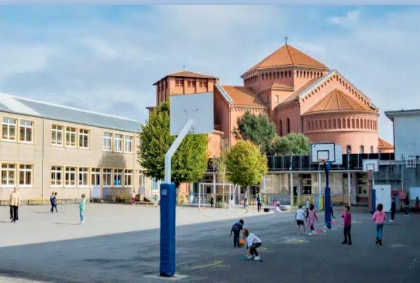
Un appel est lancé pour aider au financement des projets de l'École Sainte-Agnès et au Collège Saint-Théophane-Vénard, à Nantes.

À l'École Sainte-Agnès et au Collège Saint-Théophane-Vénard, à Nantes, des équipements d'accessibilité et de sécurité incendie sont indispensables. Un prêt de 125 000 € est sollicité auprès du Germ, mais n'est pas possible pour l'instant compte tenu de la trésorerie du fonds.