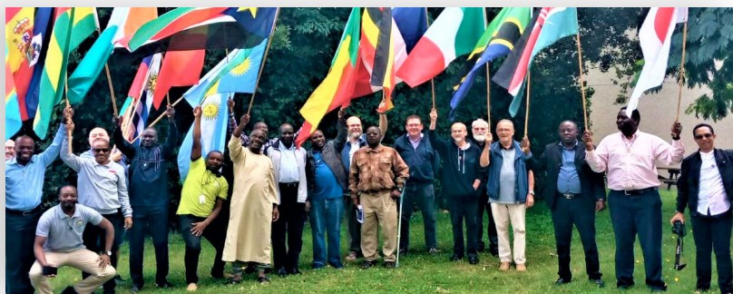
4 semaines de fraternité pour les participants lors du séjour au Lycée La Touche à Ploërmel.

https://www.lamennais.org/23-freres-en-session-a-la-touche-ploermel/ https://www.lamennais.org/fin-de-session-pour-23-freres-a-ploermel/