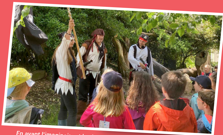
En avant l'imaginaire et les jeux au Palandrin avec Estival, France.