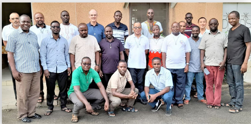
Les sujets n'ont pas manqué pour les Frères formateurs !

https://www.lamennais.org/laboratoire-16-freres-formateurs-achevent-deux-ans-dun-parcours-inedit-a-abidjan/