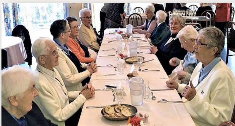
A l'ermitage St-Joseph à Cesson - sur la photo : plusieurs sœurs de la Providence lors d'un repas voici plusieurs années - s'ajoute désormais un équipement pour l'accueil temporaire.

Le 1er janvier 2009, la Congrégation des Filles de la Providence cède l'EHPAD Ermitage Saint Joseph à l'Association Montbareil. Aujourd'hui comme hier, l'Ermitage Saint-Joseph offre aux résidents laïcs et aux religieuses, un lieu de vie médicalisé adapté à leur situation, au cœur du petit bourg de Cesson.