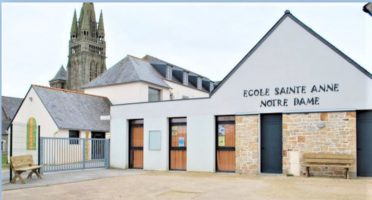
Les écoles Sainte Anne et Notre-Dame au Folgoët sont désormais regroupé sur un seul site.

Deux projets récents viennent d'être initiés. Au Folgoët, Finistère, le regroupement des deux sites des écoles Sainte Anne et Notre-Dame a été réalisé. Un prêt du Germ à hauteur de 50 000 euros a pu être accordé.