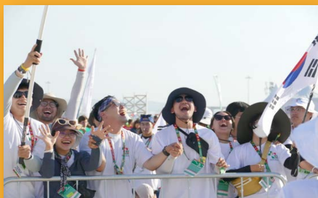
Le pape François annonce que les prochaines JMJ vont se dérouler à ...