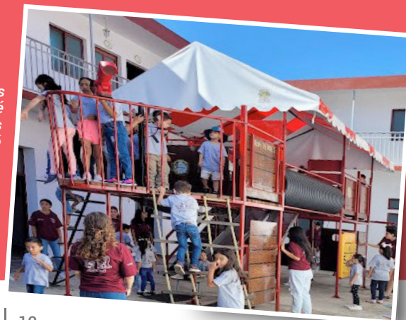
Les Vikings ont marqué les enfants de l'arche de Noé à Huatusco.

https://www.facebook.com/MenianosHuatusco