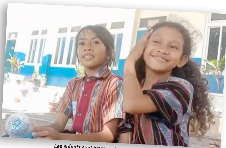
Les enfants sont heureux de retrouver l'école SDK de Larantuka, Indonésie.

La rentrée s'est bien faite dans les écoles à Pandan et Larantuka , avec la reprise du rythme ordinaire et du recrutement après les années Covid.