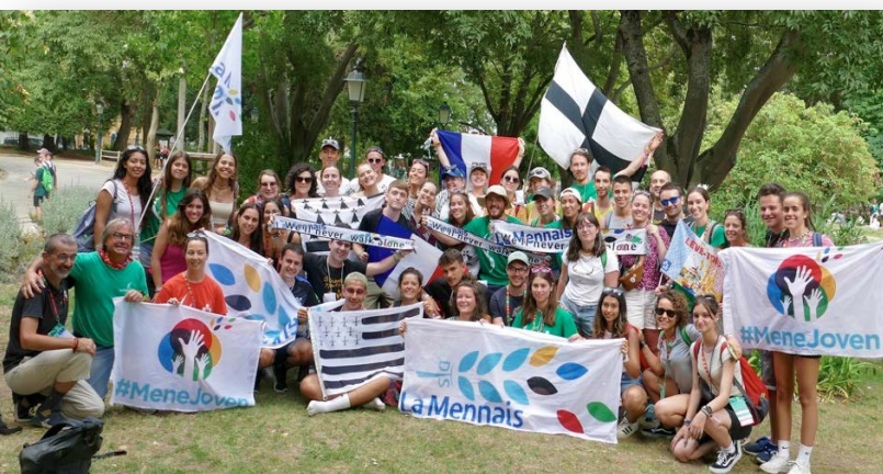
Les équipes de France et d'Espagne des délégations La Mennais.

« Nous gardons au coeur les souvenirs créés. Nous sommes touchés par le fait que le pape François s'adresse à chaque jeune. » Le 6 août il a annoncé au monde que les prochaines JMJ, en 2027 auront lieu à Séoul, en Corée du sud. Il invite aussi les jeunes en 2025 à Rome pour le Jubilé de l'Année Sainte sur le thème de l'espérance. En route !