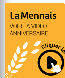
Le Collège Jean de la Mennais de La Prairie accueille 1 700 jeunes.