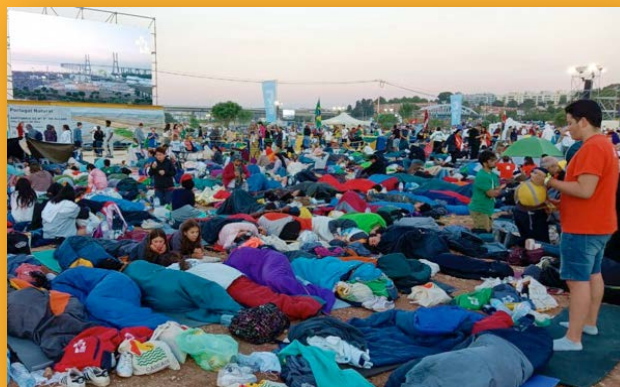
Lever du jour avec l'équipe d'Espagne.