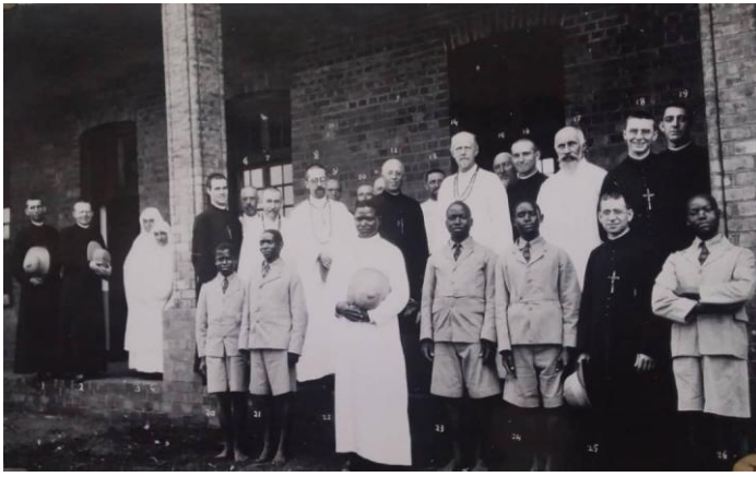
Bénédictio du nouveau bâtiment du Postulat.