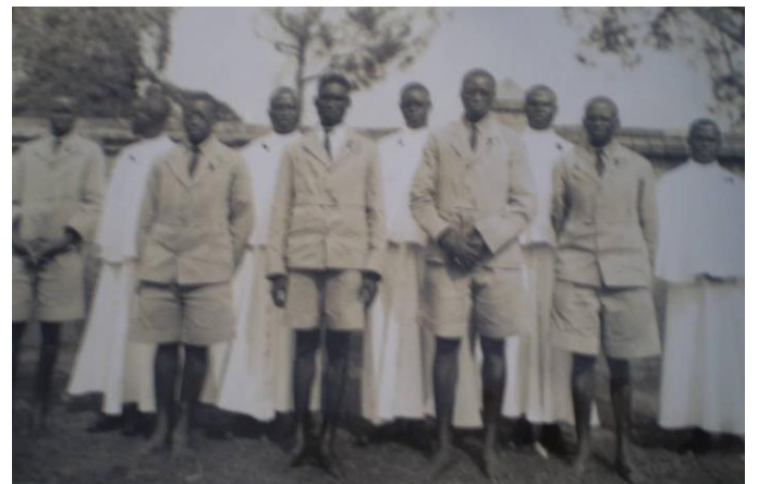
Jour des premiers vœux des 5 Novices avec le groupe des 5 nouveaux postulants

Le 6 janvier 1937, les cinq postulants les plus âgés furent admis au noviciat. Leur entrée fut marquée par la cérémonie de la prise de l'habit, au cours de