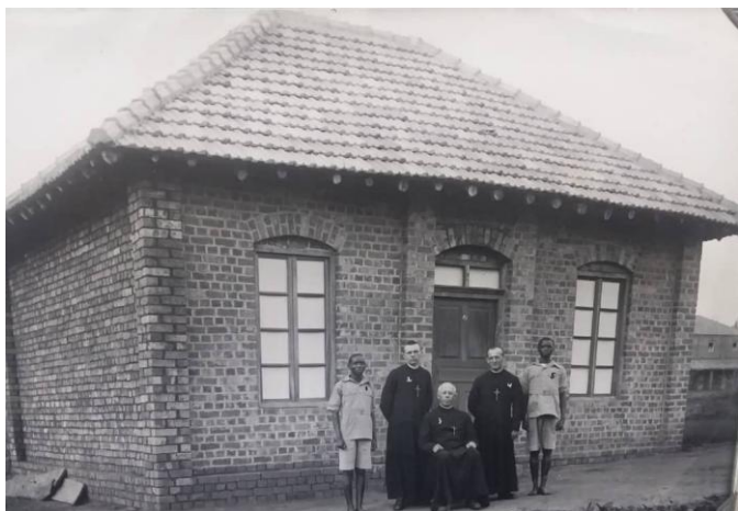
Les 2 premiers aspirants à Kisubi avec les Frères, devant la première petite maison de formation.

réfectoire, salle de prière et dortoir. Il mesurait environ 6 mètres sur 8. Les travaux de construction