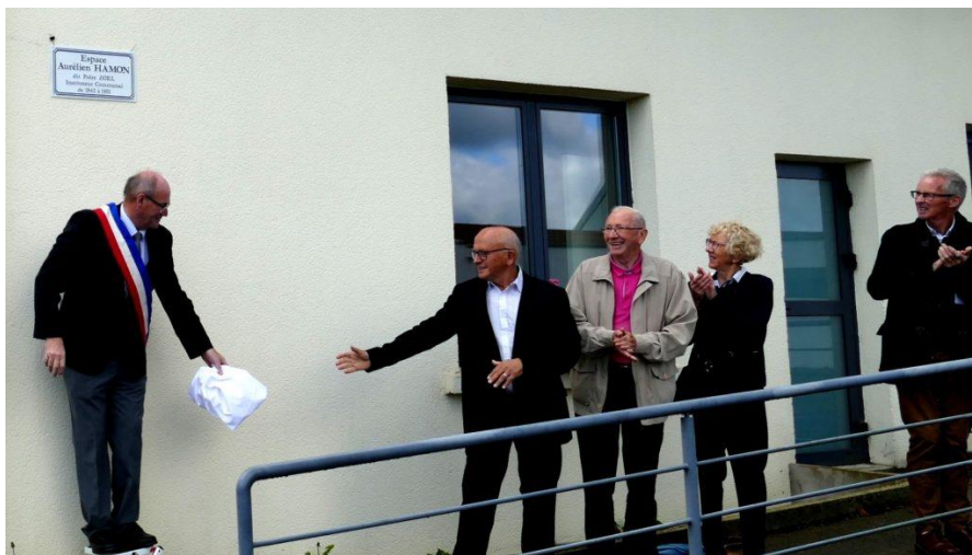
Inauguración de la placa conmemorativa del Hno. Zoel, Aurélien HAMON – a 22 de septiembre de 2019

Uno de los Hermanos que dejado en la memoria una vida de “santo”, es el H. Zoel .