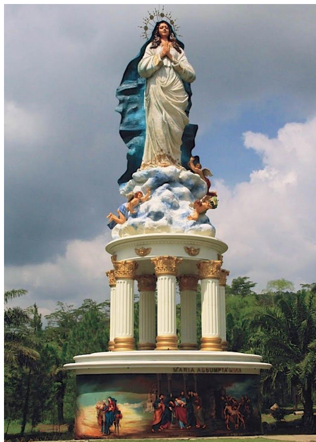
Ambarawa - Indonesia

Siempre en Indonesia, pero en la isla de Java , en Ambarawa , la Virgen María es venerada desde hace mucho tiempo en su Gua María, sobre todo por