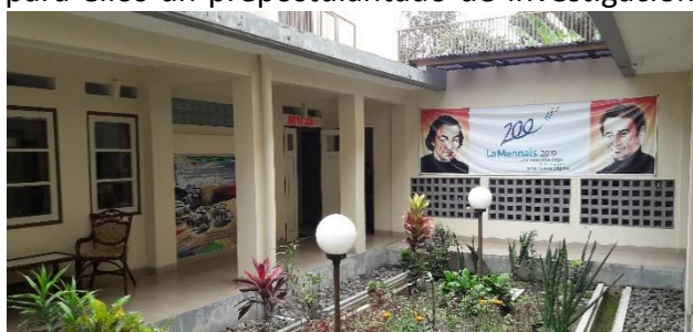
Comunidad de Yogyakarta

Unos años más tarde, los Hermanos fundaron el Pusat La Mennais , un centro de formación que ofrecía cursos de mecánica, informática, inglés, pesca y costura. Algunos jóvenes se sintieron atraídos por la vida de los Hermanos y se abrió para ellos un prepostulantado de investigación