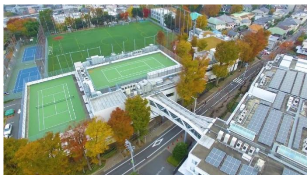
St Mary's Tokyo

El 20 de julio de 1951, la provincia canadiense de Pointe-du-Lac envió a Japón a sus tres primeros hermanos. Respondían a una invitación apremiante de la Santa Sede y a la necesidad de ayudar a reconstruir un país completamente destruido material y moralmente. La Provincia se comprometió a enviar tres hermanos al año durante los primeros 15 años. En 1971, 44 Hermanos fueron destinados allí: una enorme donación hecha por la Provincia canadiense, sobre todo porque los Hermanos enviados debían estar particularmente bien preparados en la lengua, los estudios académicos y el enfoque evangélico de un pueblo con un grado de organización muy elevado. La obra menesiana se