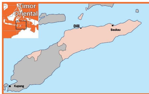
Timor Oriental (Leste) capital Dili.

La última de las misiones de los HH. menesianos