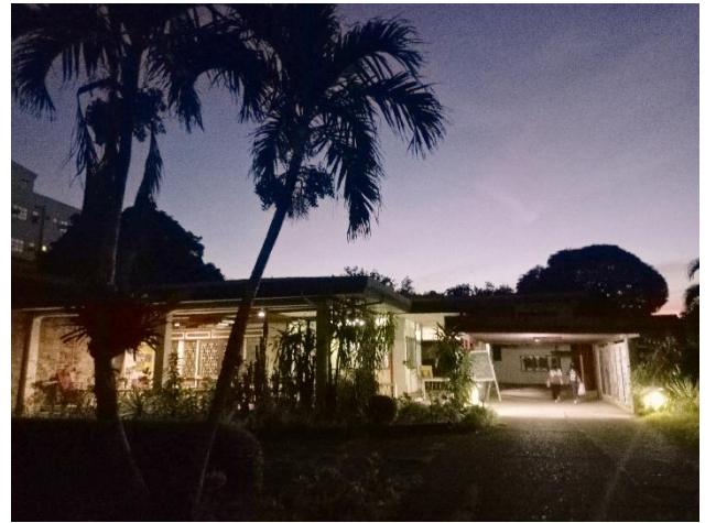
Comunidad del Postulantado y del Noviciado en San José

a la escuela un carácter menesiano. En 2012, en