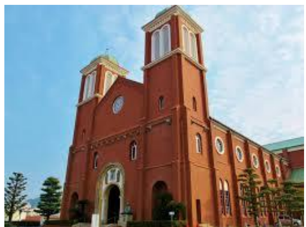
Iglesia de Urakami (catedral de Urakami)

Uno de los centros más importantes del cristianismo en Japón es la Catedral de la Inmaculada Concepción o Santa María de Urakami, en Nagasaki . Durante el siglo XIX, a pesar de todo tipo de dificultades, la comunidad católica consiguió crecer y transmitir la fe, especialmente en lugares vinculados a la