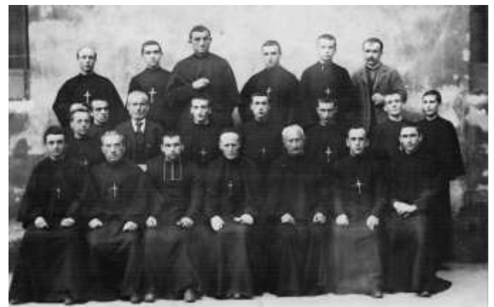
Comunidad en Nanclares (España)

5- Tras la primera impresión de excentricidad, nos dimos cuenta de su bondad. "Este Hermano