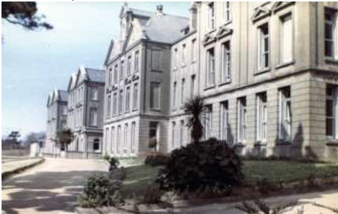
Bon Secours en Jersey