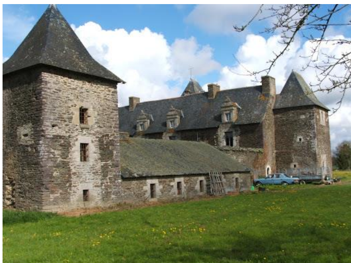
Mansión de Boyac

Será el propio Hermano quien solucionará el problema. Lo antes posible, se apresura a regresar a