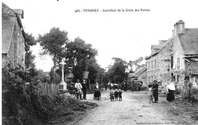
Pengilly - Costas de Armor

En 1863, el H. Urbain tenía 61 años y sus fuerzas empezaban a fallar. Los Superiores consideraron oportuno asignarle la dirección de una escuela más pequeña. Fue enviado a Pengilly (antes Pengilly), un pueblo que entonces contaba con unos 600 habitantes y que todavía se encuentra en las Costas de Armor. Le llevó poco tiempo ser apreciado por su competencia educativa, su celo apostólico, sus buenas relaciones con el rector y la población. Un episodio arrojará luz sobre su extrema generosidad en este período, que de otro modo habría permanecido bastante oscuro.