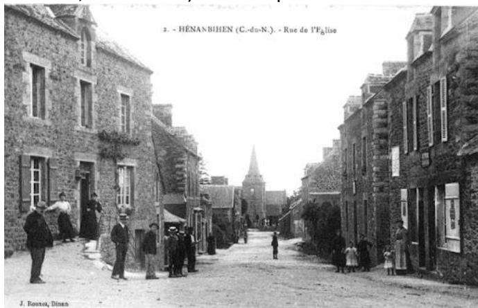
Hénanbihen - Costas de Armor