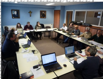
Frères et Laïcs réunis le 28 février 2015 pour la préparation de cette Assemblée.