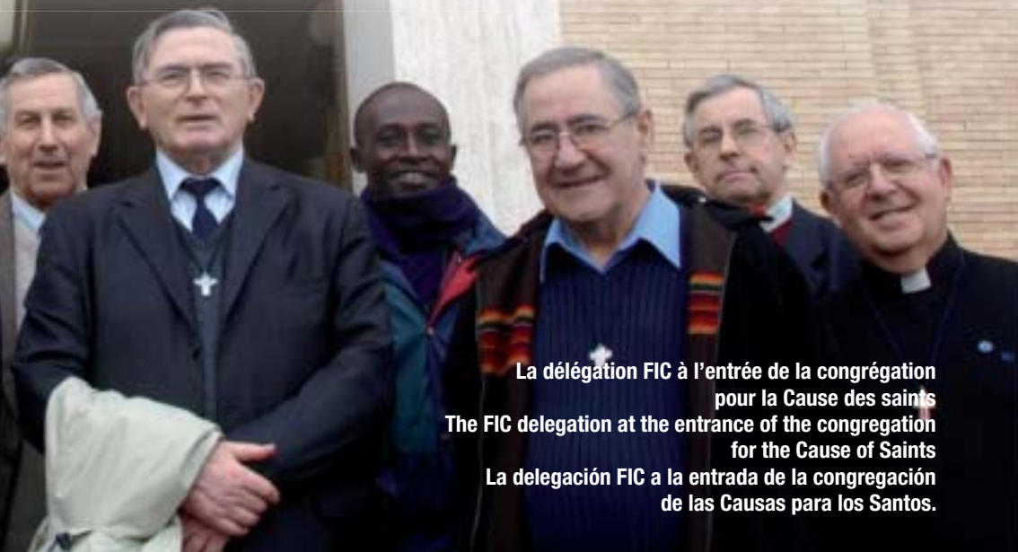
La délégation FIC à l'entrée de la congrégation pour la Cause des saints The FIC delegation at the entrance of the congregation for the Cause of Saints La delegación FIC a la entrada de la congregación de las Causas para los Santos.