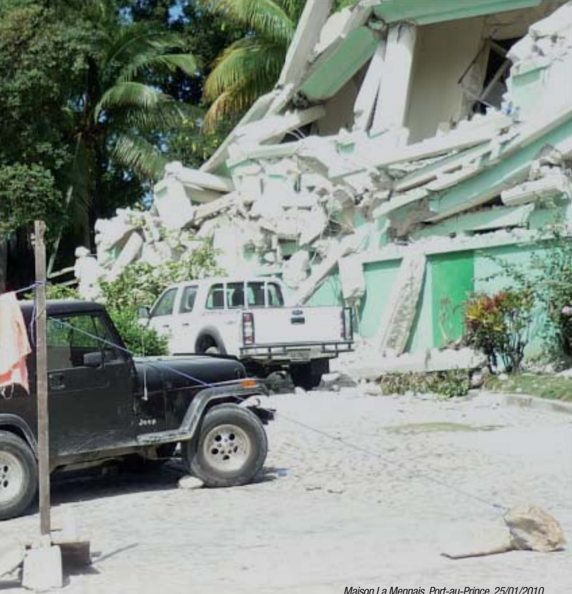
Maison La Mennais, Port-au-Prince. 25/01/2010.

Frère d'exil comme tant d'autres qui pleurent Dans le silence , J'ai pourtant rêvé d'une terre promise où la saison Des hommes est celle du bonheur (...)